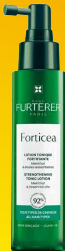
SHAMPOO TRATTAMENTI SPECIFICI